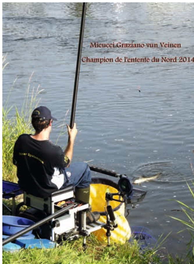
Text & Foto : Kleman R.J.